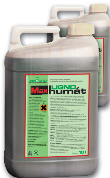
Lignohumát Max je dodáván v balení 5, 10 a JUMBO 1000 l

Lignohumát je zaregistrován u ÚKZUZ jako pomocný rostlinný přípravek a má charakter přírodního růstového stimulátoru.